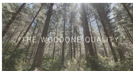
「ブランドムービー」

ウッドワンは、1990年からニュージーランドに自社森林を保有し、苗木を植え、約30年かけて育て、無垢の木の内装ドア、床材、階段材、システムキッチンなどの住宅用内装建材、設備を製造販売しています。