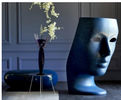
左：“Koishi” (デザイナー：深澤直人)