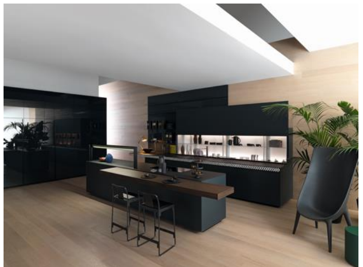
Valcucine Tokyo / キッチン：“Genius Loci (ジーニアスロッチ)”

担当：田中 栞 (Valcucine Tokyo 広報) TEL：070-3769-0173 (携帯) Mail： shiori.tanaka@cleanup.jp