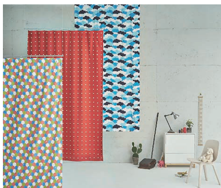
リリカラ × 青衣 あをごろも ( http://www.aogoromo.jp/ )