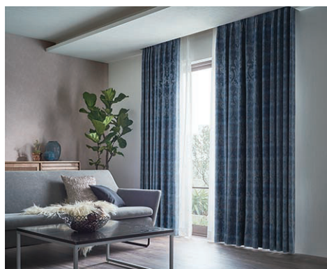
『ファブリックデコ (FD-53002)』×『ライト (LL-5081)』

また、京都のテキスタイルブランド「青衣 あをごろも」とコラボした子供部屋におすすめのカーテンや、和モダン空間や間仕切りに最適なマリモ編みの「ART LACE ゆらぎ」を新たに収録し、幅広い住宅シーンにお応えするラインナップをご用意しました。