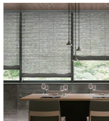
ART LACE ゆらぎ (FD-53610Y)