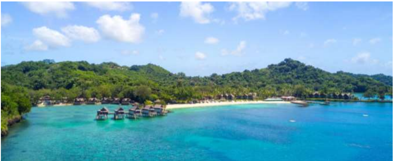
パラオ パシフィック リゾート全景

パラオ パシフィック リゾートは、パラオ共和国コロール州アラカベサン島の西岸にある 1984 年に開業した、現在パラオ国内で最多の客室を有するリゾートホテルです。約 250m のプライートビーチからは目の前に広がる太平洋を一望でき、一年中サンセットを眺めることができます。パラオの自然と伝統を思う存分お楽しみいただくことができ、ユネスコの世界遺産（複合遺産）「ロックアイランド群と南ラグーン」も至近距離に臨む絶好の立地にあるビーチリゾートです。