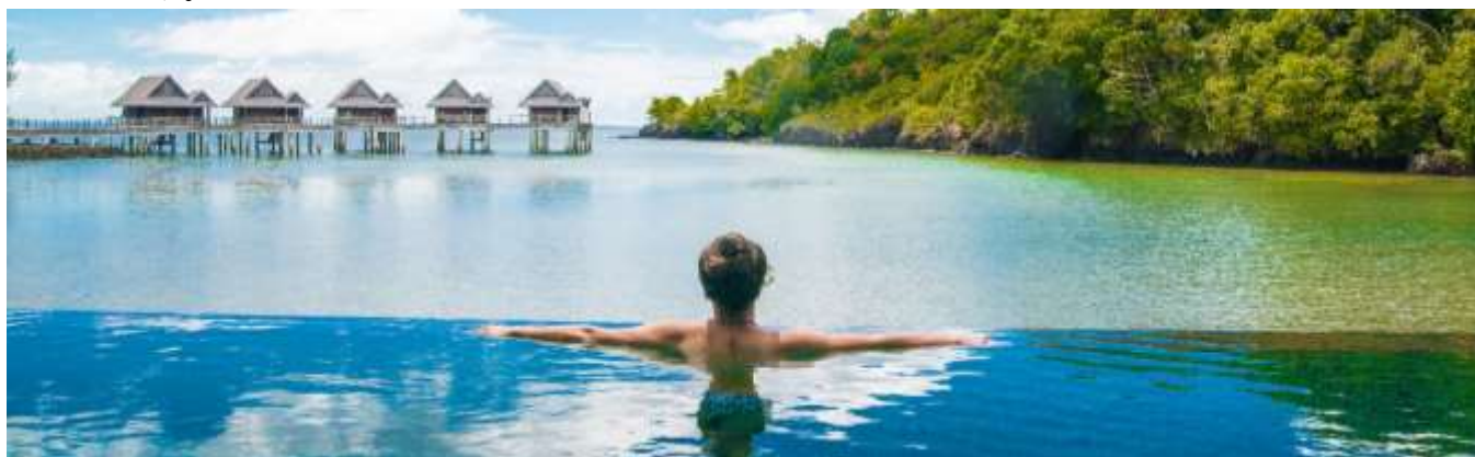
ラグーンビュー プールヴィラ プライベートプールより