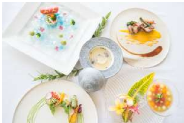
ディナーイメージ

また、「The Pristine Villas and Bungalows at Palau Pacific Resort」ではレストランのほかに、滞在されるゲストのための、専用レセプション、ライブラリー、ラウンジ、プール等で構成されたパブリック棟も新設し、独立したハイグレードなエリアとしてゲスト満足度の向上に努めます。