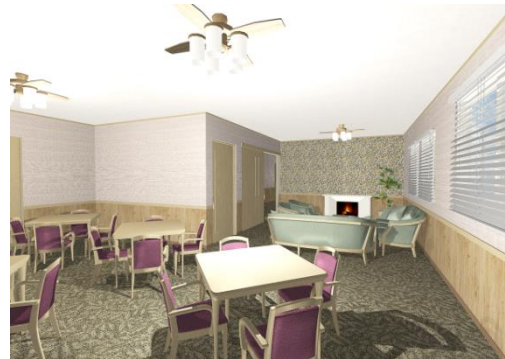
③リビングルームイメージパース