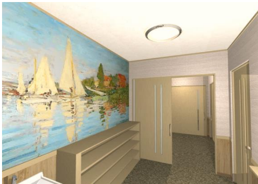
②玄関イメージパース