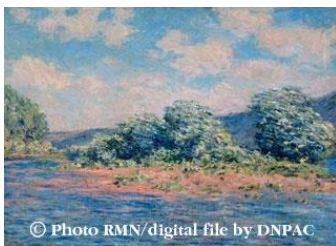
ポール＝ヴァレのセーヌ河 クロード・モネ 作 W1770×H900