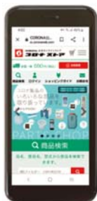
公式オンラインストア

エコキュートの操作以外にもお役立ち情報サイトやWEB修理受付など便利な機能を搭載しております。