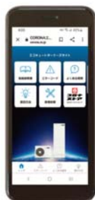
オーナーズサイト